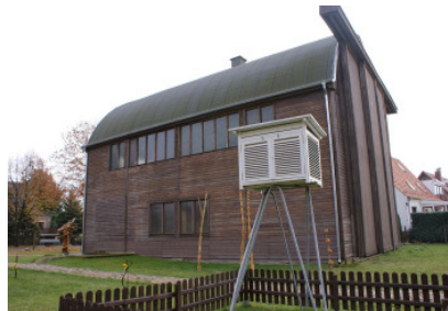
(historische Ballonhalle Lindenberg)

Gearbeitet werden kann in allen Techniken. Ob Sie die leuchtenden Farben der Aquarelltechnik einsetzen oder Acrylfarben schichtweise aufspachteln wollen: jeder Teilnehmer wird individuell in seiner gewählten Technik und Bildauffassung unterstützt und gefördert. Auf diese Weise profitieren alle Teilnehmer von den unterschiedlichen Vorgehensweisen, sich dem Thema Himmel - Wolken - Wind zu nähern, gleichgültig, ob das Thema gegenständlich oder abstrakt umgesetzt werden soll.